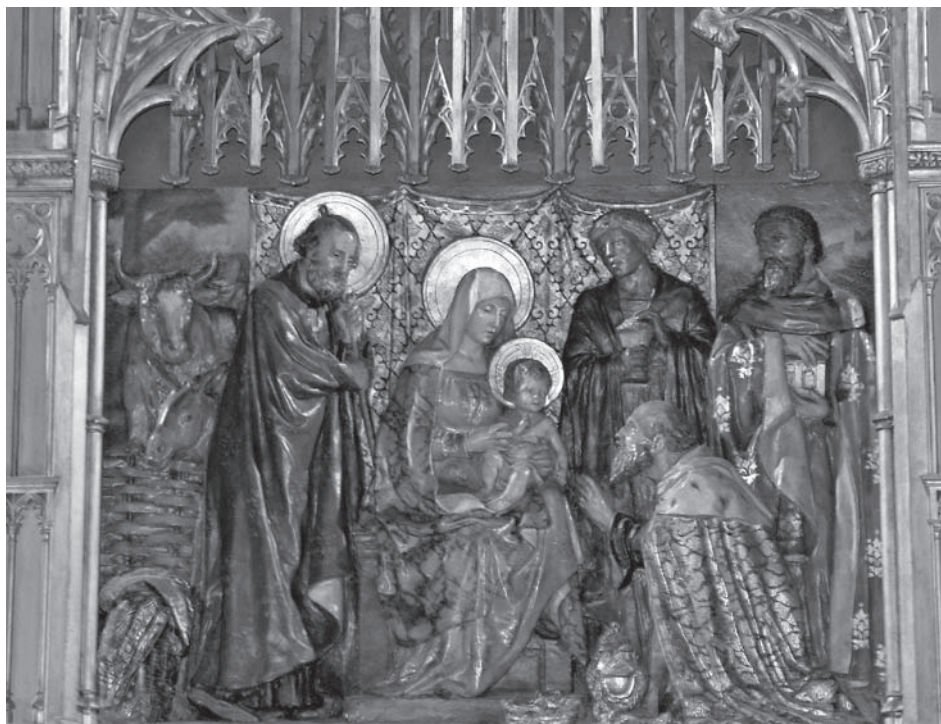
Detalj från altartavlan i Visby domkyrka.