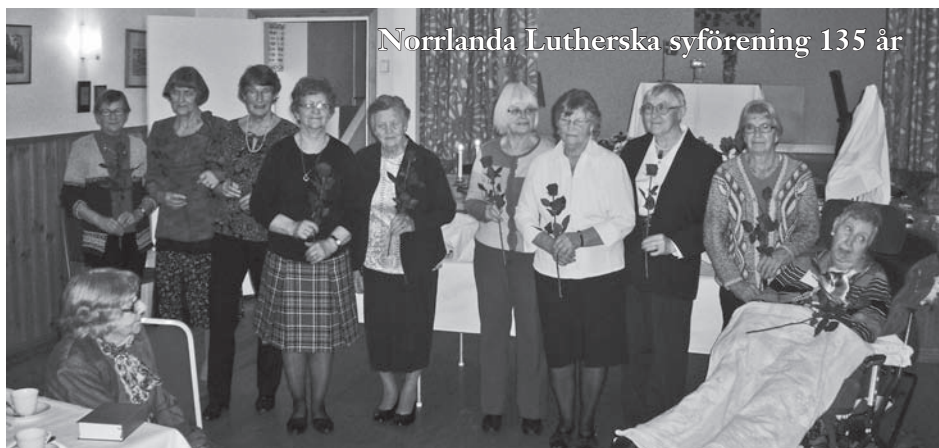
Norrlanda Lutherska syförening 135 år