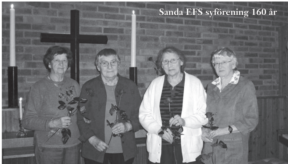
Sanda EFS syförening 160 år