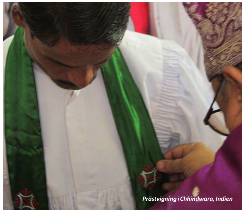
Prästvigning i Chhindwara, Indien